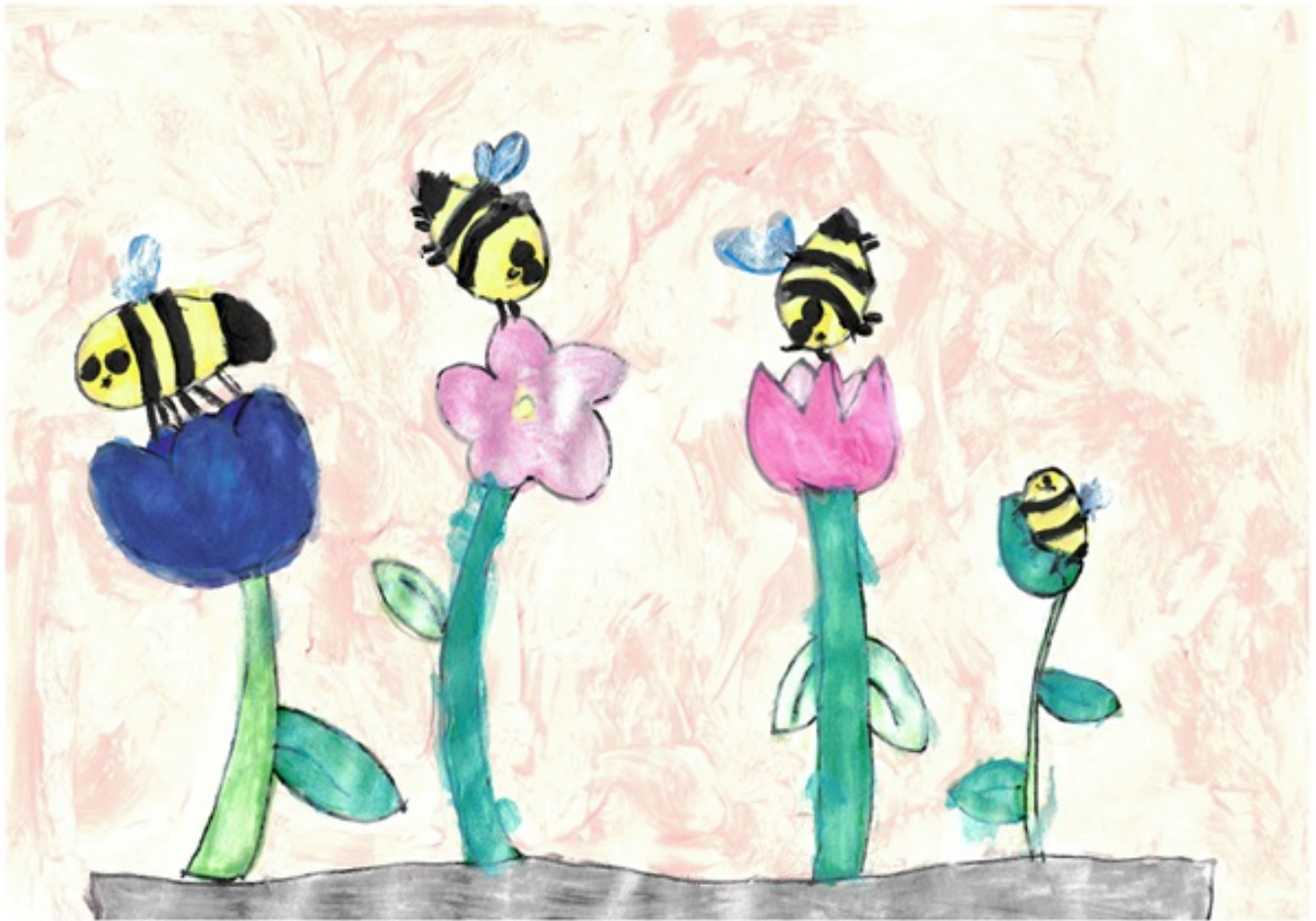
Wyróżnienie: Jaśmina Czyżyk-Skoczyk, Szkoła Podstawowa nr 18