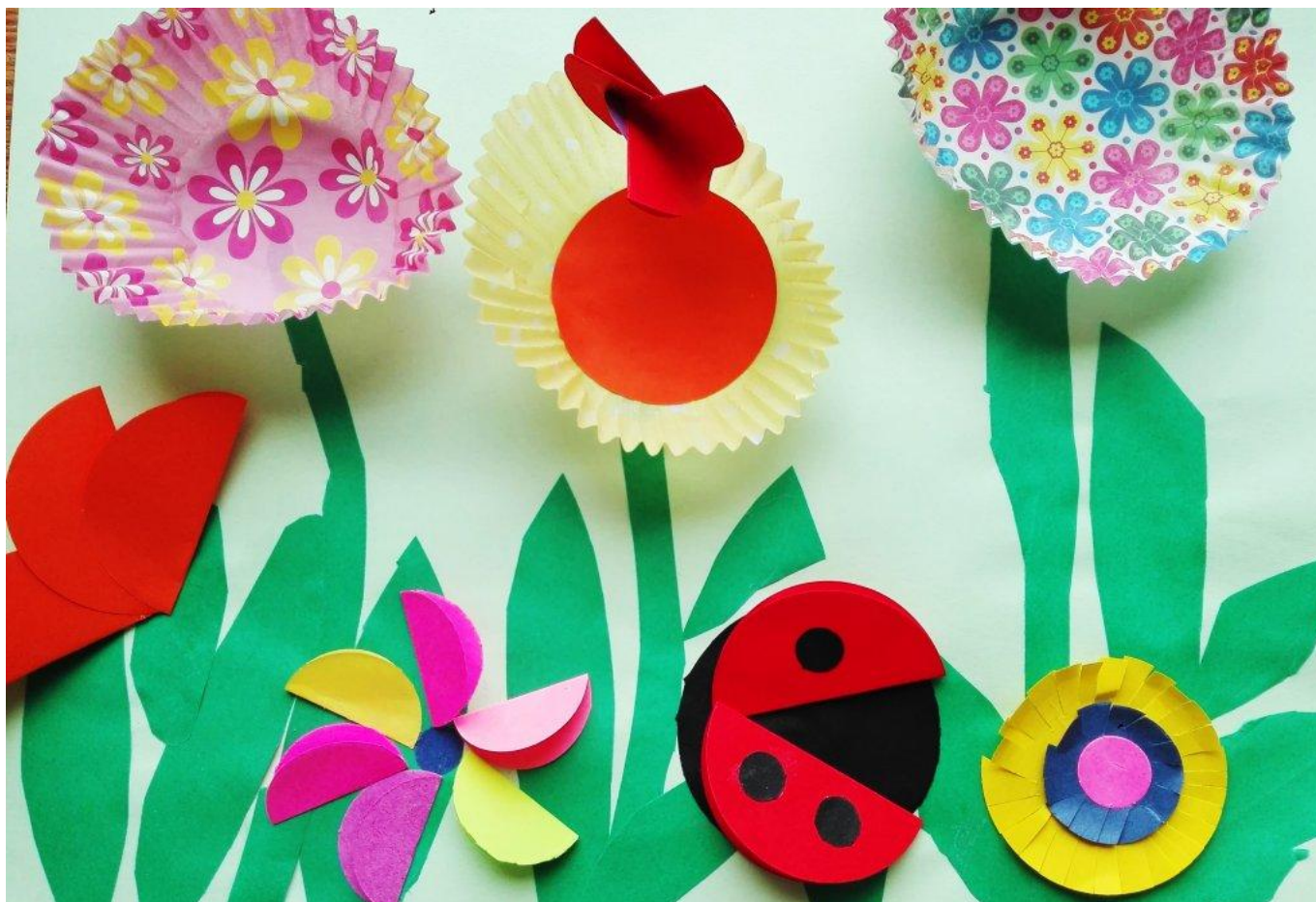
Wyróżnienie: Nina Siporska, – Przedszkole Nr 21