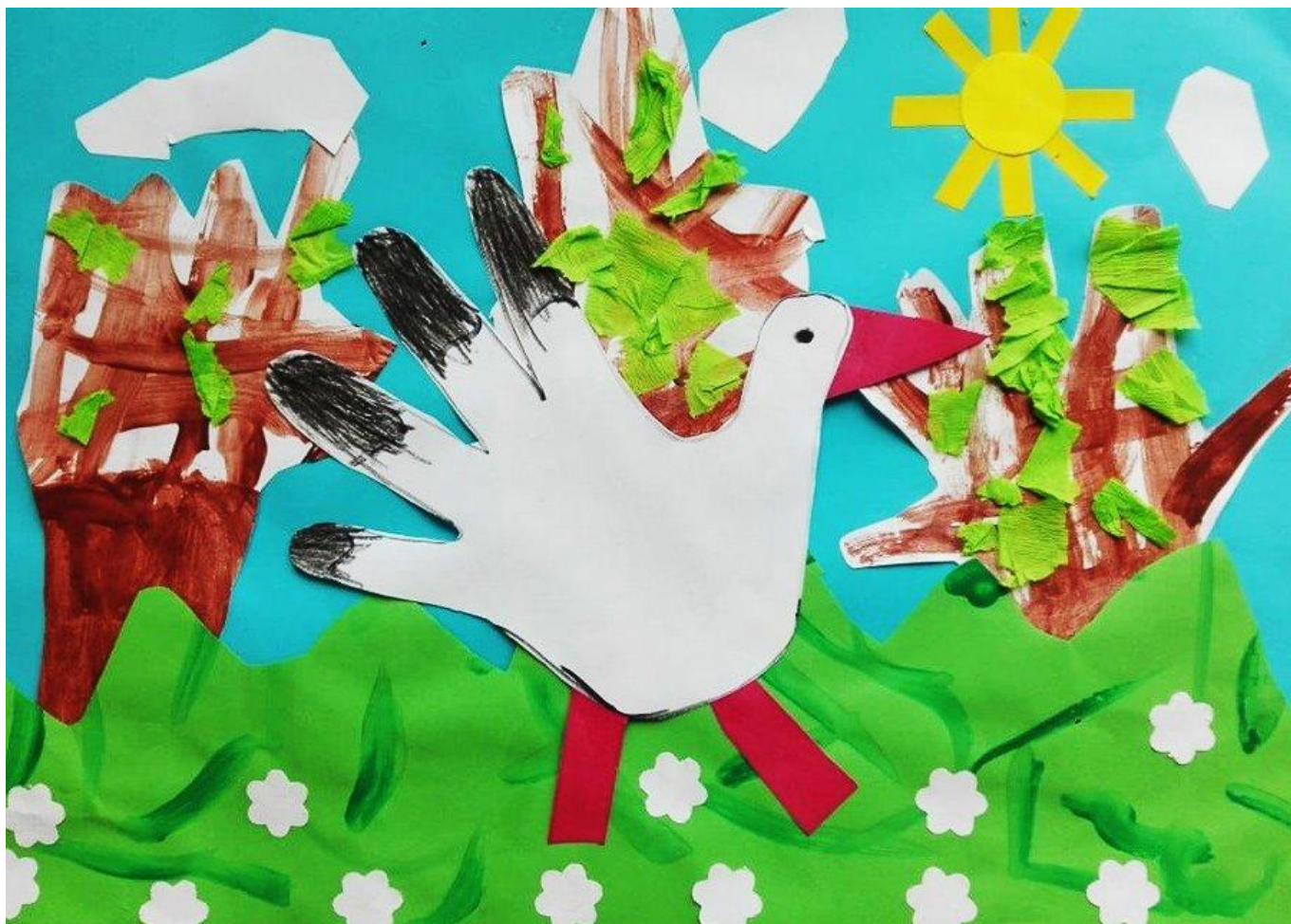
Wyróżnienie: Aleksandra Trzeciak, Przedszkole Nr 8