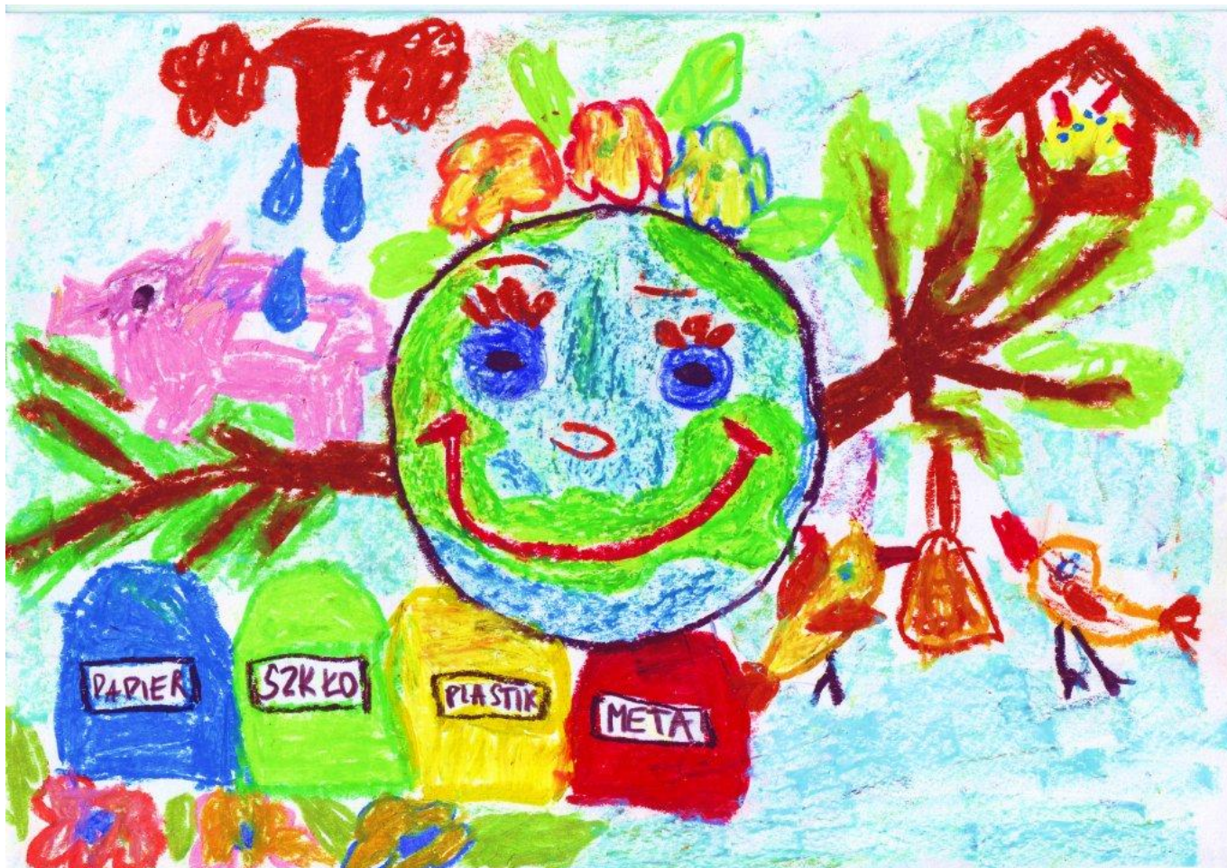
Wyróżnienie: Łukasz Kupisz klasa Ia SOSW Nr 2