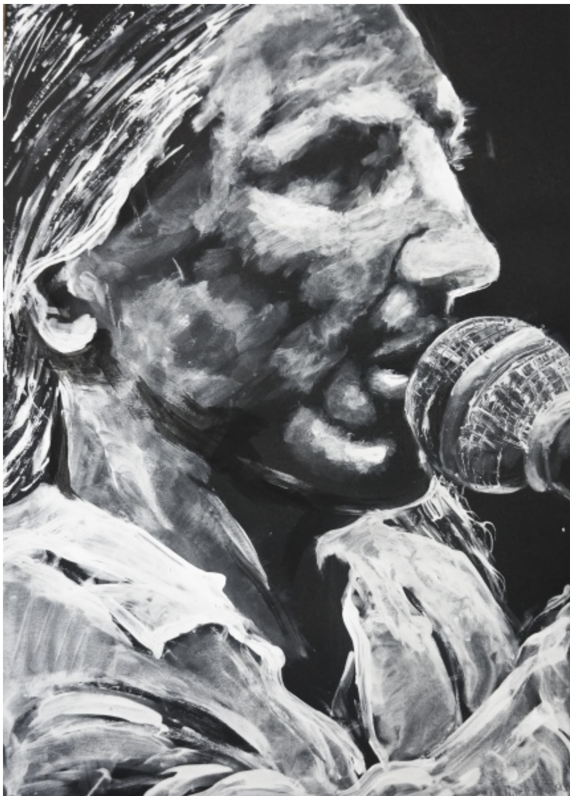
Młodzieżowy Dom Kultury